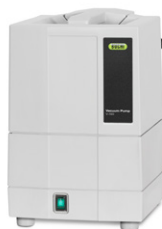
Vacuum Pump V-100 Sumber vakum ekonomis