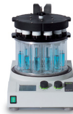
Multivapor™ P-6 / P-12 Evaporasi yang efisien untuk banyak sampel