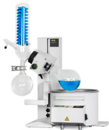
Rotavapor® R-100 Evaporasi ekonomis