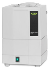
Vacuum Pump V-100 经济实用的真空源