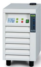
Recirculating Chiller F-100 / F-105 轻松的冷却方式